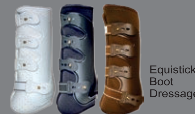
Equistick Boot Dressage