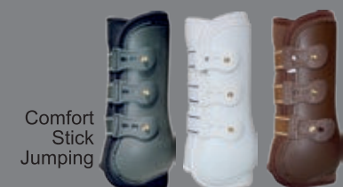
Comfort Stick Jumping

Pferd International - München 10.-13.05.2018 Schloßpark Wiesbaden 18.-21.05.2018 Equitana Open Air - Neuss 25.-27.05.2018