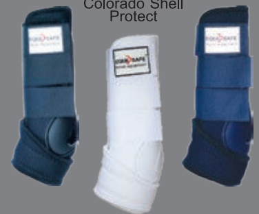
Colorado Shell Protect