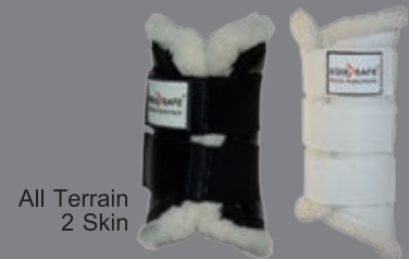
All Terrain 2 Skin